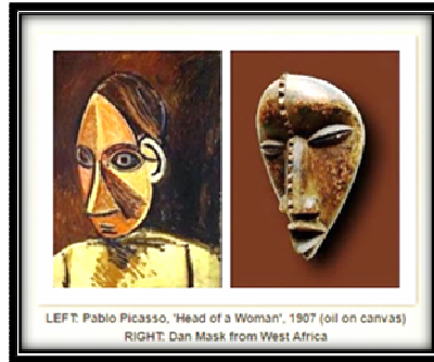
LEFT: Pablo Picasso, 'Head of a Woman', 1907 (oil on canvas) RIGHT: Dan Mask from West Africa